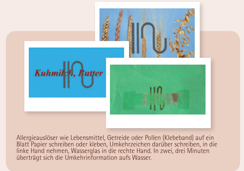
Allergieauslöser wie Lebensmittel, Getreide oder Pollen (Klebeband) auf ein Blatt Papier schreiben oder kleben, Umkehrzeichen darüber schreiben, in die linke Hand nehmen, Wasserglas in die rechte Hand. In zwei, drei Minuten überträgt sich die Umkehrinformation aufs Wasser.

Es gibt bereits eine Vielzahl von Methoden,